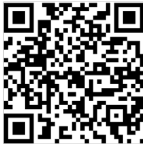
台東咖啡品牌官網